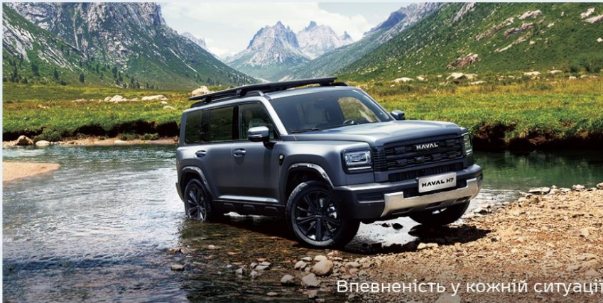
Впевненість у кожній ситуації