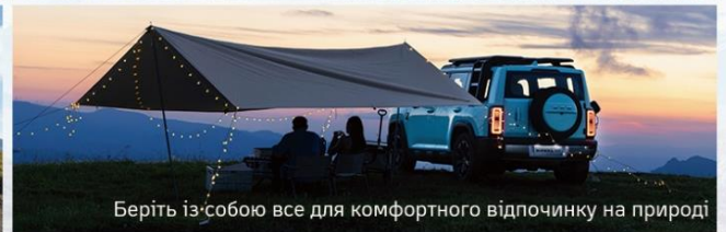
Беріть із собою все для комфортного відпочинку на природі