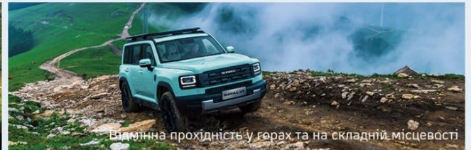
Відмінна прохідність у горах та на складній місцевості