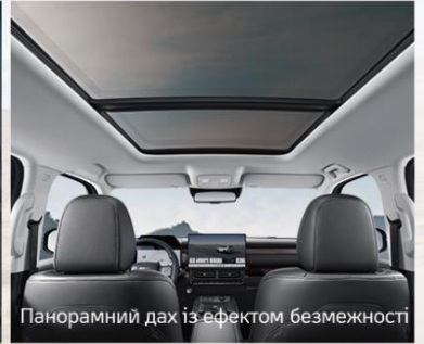
Панорамний дах із ефектом безмежності