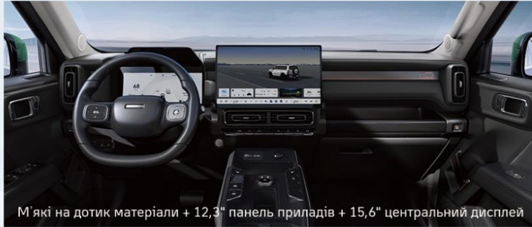
М'які на дотик матеріали + 12,3" панель приладів + 15,6" центральний дисплей