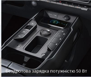
Бездротова зарядка потужністю 50 Вт