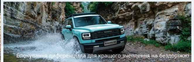
Блокування диференціала для кращого зчеплення на бездоріжжі