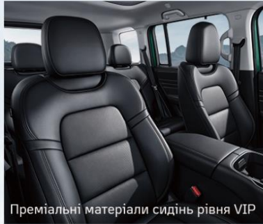
Преміальні матеріали сидінь рівня VIP